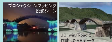
▲2015.5.30 山口県岩国市 錦帯橋