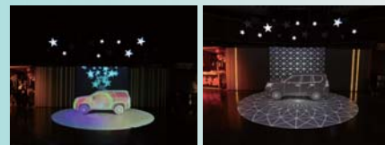
▲2015.11.17 品川プリンスホテル クラブeX