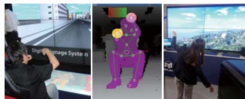
6KデジタルサイネージAirDriving