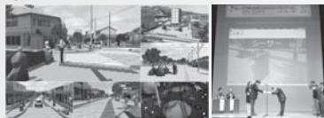
「境港市水木しげるのロード」