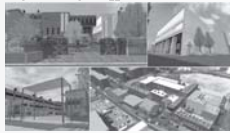
「後世に残す我が母校、伏見工業高校」 京都市立伏見工業高等学校