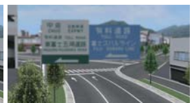
▲視力が低下した状態