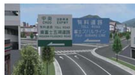
▲視力が良好の状態