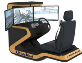
コンパクトドライブシミュレータ 本体価格:360万円(レンタル可)

脳機能のリハビリ: 自動車を運転することで脳が活性化する 身体機能のリハビリ: 体を使って運転することで、身体機能のリハビリとなる 社会復帰: 運転技術向上、交通ルール遵守など社会復帰に向けた訓練を行う