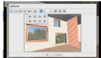
▲VR-Cloud®による遠隔での設計協議