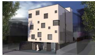
▲景観シミュレーション