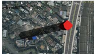
▲周辺の日影シミュレーション