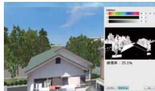
▲自主簡易アクセスツール(緑視率の検討)