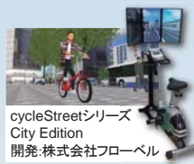
cycleStreetシリーズ City Edition 開発:株式会社フローベル

エアロバイクによるバーチャルサイクリングシステムと連携。ペダルを漕ぐと速度に応じてVR空間内を走行可能。