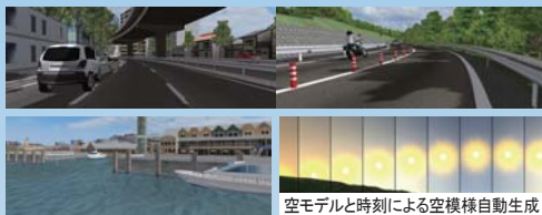
空モデルと時刻による空模様自動生成

湖沼反射のリアルタイム表現、時刻による空模様自動生成が可能。影レンダリングの性能と品質も向上。