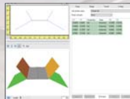
土工断面定義画面 / 自動的にデフォルトの土工断面を生成。