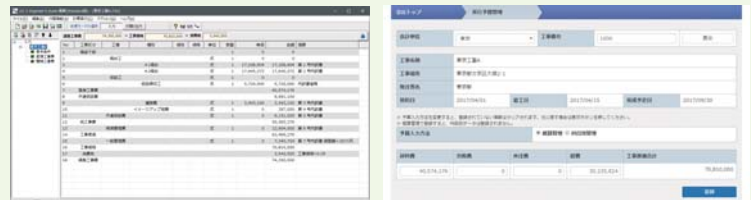
UC-1 Engineer's Suite 積算(左)連携による概算の実行予算管理