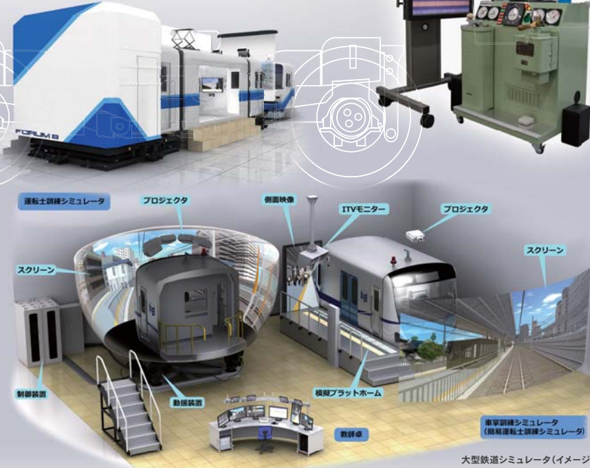
大型鉄道シミュレータ(イメージ図)

研究開発、教育・訓練、広報展示目的の鉄道運行シミュレータ Advanced ¥970,000 Standard / Advanced / Driving Sim / Ultimate