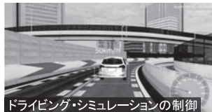
ドライビング・シミュレーションの制御