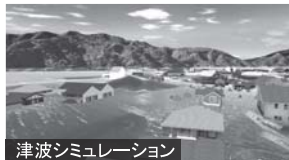
津波シミュレーション