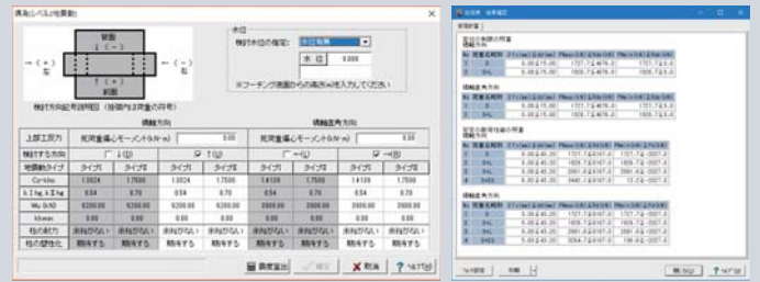
▲橋脚の設計・3D配筋 (部分係数法・H29道示対応) Ver.2 荷重: 偶発(レベル2地震動) 画面

平成29年11月 道路橋示方書・同解説対応版を順次リリースしています。 詳細 http://www.forum8.co.jp/forum8/products-h29doji.htm