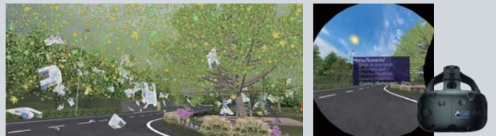
▲UC-win/Road Ver.13 新機能 気象表現拡張 / VIVE操作画面

UC-win/Road Ver.13リリースを記念して、UC-win/Roadのプラグイン・別売りオプションをどれでも 30%OFF でご購入いただけます。