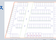
▲駐車マスの一括配置、編集

駐車場規格 (標準駐車場条例・道路構造令) に基づいた駐車場設計を支援 (平面図作図) するCADシステムです。本システムでは2次元汎用CADの簡単な操作で「駐車場区画 (外周、車両出入り口、通路など) を作図するのみで駐車場区画内に駐車マスを自動配置する機能」や「駐車マスを個別に編集する機能」を備えているため、駐車場図面の作成が容易かつ効率よく行えます。また、作成した駐車場図面は「車両軌跡作図システム」に連携して車路および駐車マスへの車両旋回シミュレーションを行うことができます。