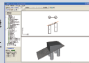
▲メインウィンドウ (面内解析モデル)