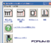
▲システムB起動画面