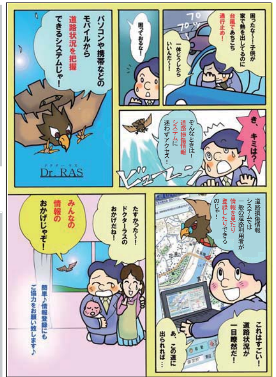
RAS=Road Alert System