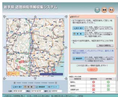
▲地図とアイコンにより、被災状況の把握が容易に可能