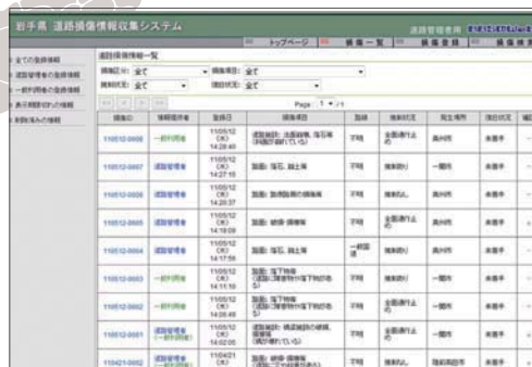
▲管理者は登録された道路損傷情報などを地域ごとに管理できる