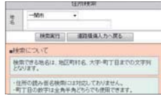
▲日本全国の災害情報が収集できます

一般の方による道路情報の閲覧・登録、道路管理者による道路情報の管理ができます。全国運用も可能です。一部自治体で導入運用されています。