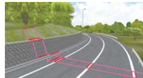
▲道路のクアッド情報 (道路の形状の取得)