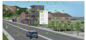
▲受音点の表示と選択 (オブジェクトインスタンス)