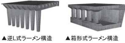
▲逆L式ラーメン構造 ▲箱形式ラーメン構造

逆L式ラーメン構造は、主梁、谷側柱、山側受台(重力式)、谷側受台(逆T式)から構成されています。構造解析モデルとしては、主梁と柱が剛接され、柱基部および山側支承位置をヒンジ支点とする1次不静定構造を考えます。本製品では、主梁はT形断面、柱は矩形断面とし、鉄筋並びにPC鋼材を配置したPC(PRC)断面照査を行います。