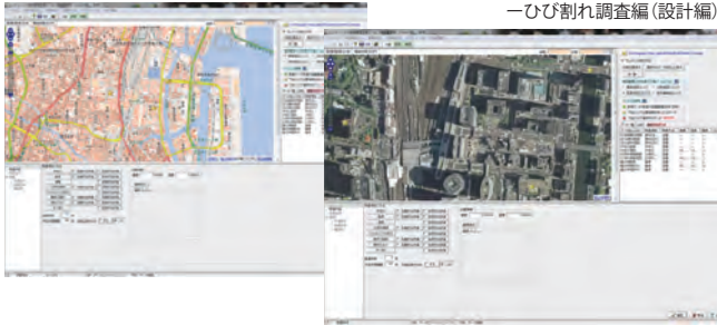
▼写真地図表示モード —ひび割れ調査編(設計編)