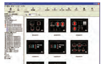
▼登録ファイルサムネイル表示