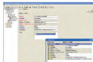
▼管理項目初期値設定・登録機能