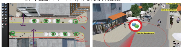
▲視点位置はVRでシーンを自在に選定 ▲ディスカッション注釈の3Dアイコン表示