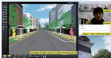
▲デザインミーティングの例：メイン画面での手書きでデザイン入力ビデオ会議システム (Skype) を利用した協議シーン