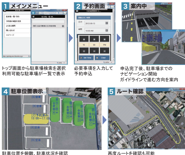
トップ画面から駐車場検索を選択 利用可能な駐車場が一覧で表示