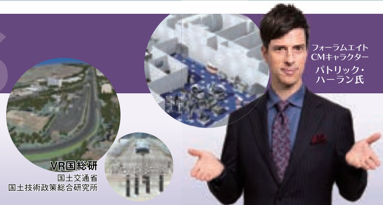
フォーラムエイト CMキャラクター パトリック・ ハーラン氏