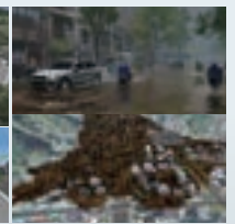
3次元ハザードマップ(津波・避難シミュレーション/防災・減災対策)