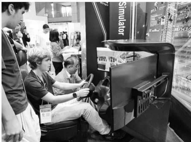
フォーラムエイトはVRシミュレーターを実演した

最新のサイネージ装置 展示された。カラー化を重点を置いた経営」に取組む中、「Next-generation global environment」をテーマに、「創・蓄・省で実現するSHARPのカーボンニュートラル」、「SHARPのサステナビリティ」、「DIGITAL HEALTH CARE」、「独自技術(ネイチャーテクノロジー)の4つのゾーンで、人と社会と地球のため、最新のサイネージ装置など