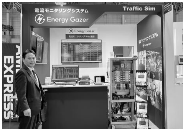
トラフィック・シムの福岡社長は電流モニタリングシステム「Energy Gazer」をアピール

最新のサイネージ装置 展示された。カラー化を重点を置いた経営」に取組む中、「Next-generation global environment」をテーマに、「創・蓄・省で実現するSHARPのカーボンニュートラル」、「SHARPのサステナビリティ」、「DIGITAL HEALTH CARE」、「独自技術(ネイチャーテクノロジー)の4つのゾーンで、人と社会と地球のため、最新のサイネージ装置など