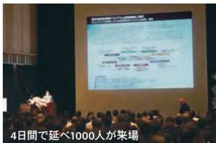
4日間で延べ1000人が来場

フォーラムエイトでは毎年11月に「デザインフェスティバル-3Days+Evening」を開催。会期中には自動運転に関連する4省庁からの講演や、3D・VRを活用した作品コンテスト、国土強靱化ソリューションの提案、プログラミングおよびBIM・CIMデザインの国際学生コンペの公開プレゼン・表彰式等が行われました。2019年は、大成建設様による「UC-win/Roadを活用した建設機械の自動運転技術開発」についての特別講演を実施しました。