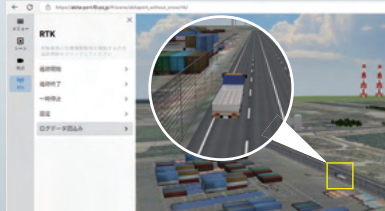
メタバースF8VPSによるモニタリングイメージ (GPS位置情報リアルタイム連携)

港湾におけるトラック自動運転技術 活用の安全性検証・自動運転技術の検証 秋田県港湾部