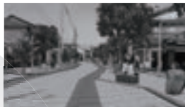
境港市水木しげるロード