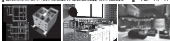
モデリング、レンダリング、アニメーション、3Dプリントまでオールインワンの3DCGソフトウェア