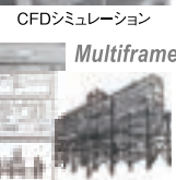
CFDシミュレーション