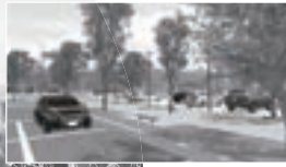
周辺地形・自然環境・交通流、防災検討