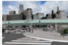
UC-win/Roadに読み込み後の同じ視点