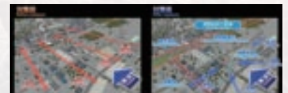
津波避難シミュレーション (パンフィックコンサルタンツ株式会社)

株式会社 フォーラムエイト 東京本社 東京都港区港南 2-15-1 品川インターシティ A 棟 21F