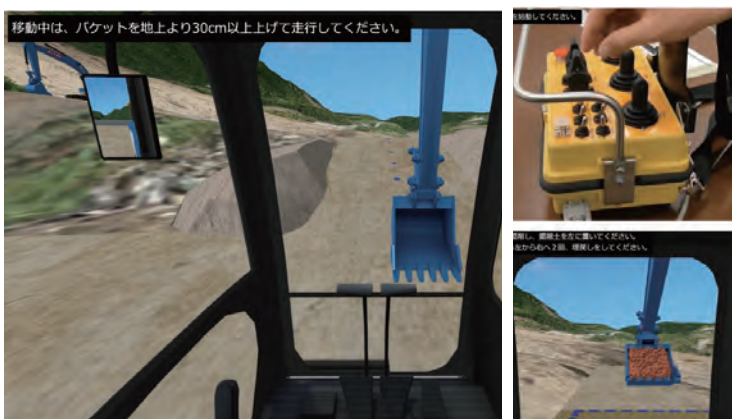
▼システム事例:遠隔操縦操作訓練用シミュレータ 国土交通省九州地方整備局九州技術事務所