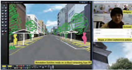
▲デザインミーティングの例：メイン画面での手書きデザイン入力ビデオ会議システム (Skype) を利用した協議シーン