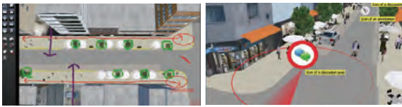
▲視点位置はVRでシーンを自在に選定 ▲ディスカッション注釈の3Dアイコン表示