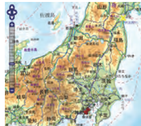
▼地理院地図イメージ