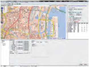
▼管理対象構造物の一元管理 —ひび割れ調査編(設計編)