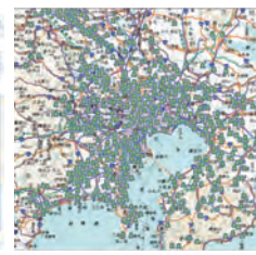
▼スタッフ位置の表示