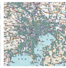
▼スタッフ位置の表示