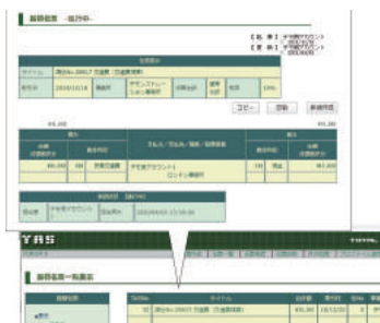
▲会計システム (TAS/Total Accounting System)