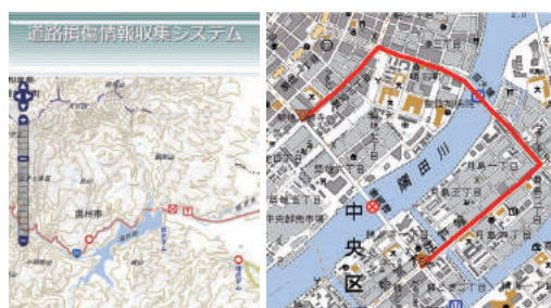
▲道路損傷情報収集システム