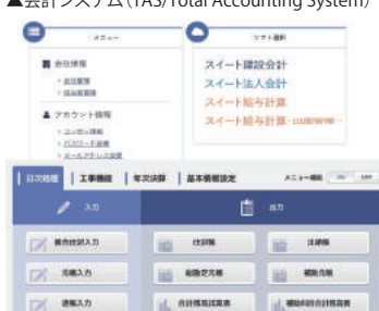
▲スイート会計シリーズ (法人会計・給与計算)