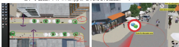
▲視点位置はVRでシーンを自在に選定 ▲ディスカッション注釈の3Dアイコン表示