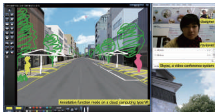
▲デザインミーティングの例：メイン画面での手書きデザイン入力 ビデオ会議システム (Skype) を利用した協議シーン