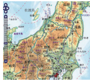
▼地理院地図イメージ