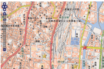
▼管理対象構造物の一元管理 —ひび割れ調査編(設計編)