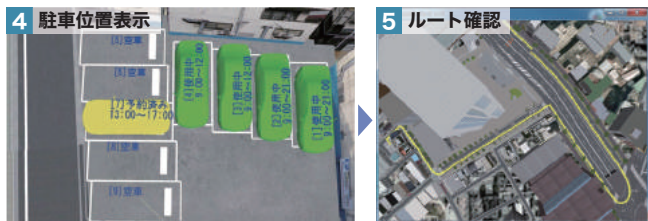
駐車位置を俯瞰、駐車状況を確認