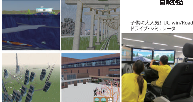
子供に大人気！ UC-win/Road ドライブ・シミュレータ