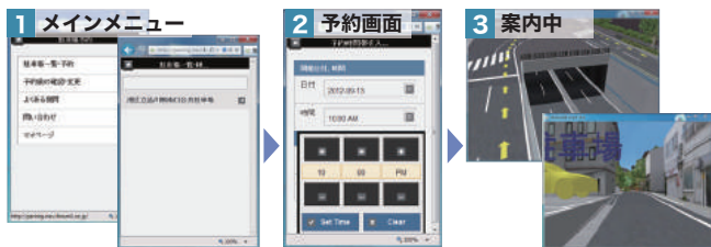
トップ画面から駐車場検索を選択 利用可能な駐車場が一覧で表示