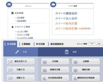
▲スリート会計シリーズ (法人会計・給与計算)