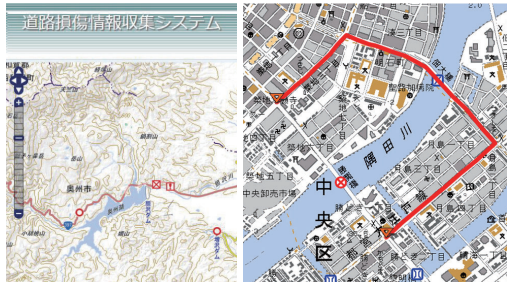
▲道路損傷情報収集システム ▲迂回路検索システム