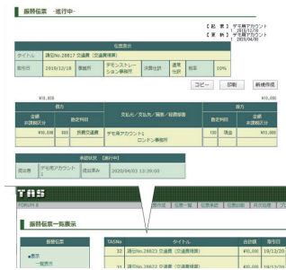
▲会計システム (TAS/Total Accounting System)