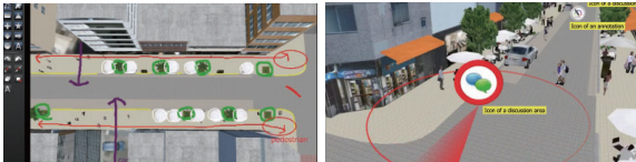
▲視点位置はVRでシーンを自在に選定 ▲ディスカッション注釈の3Dアイコン表示