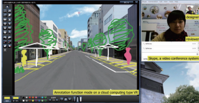
▲デザインミーティングの例：メイン画面での手書きデザイン入力ビデオ会議システム (Skype) を利用した協議シーン