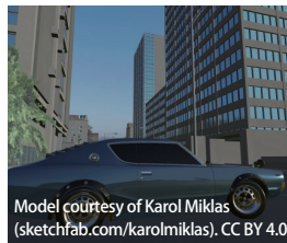
Model courtesy of Karol Miklas (sketchfab.com/karolmiklas). CC BY 4.0.