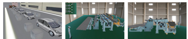
▲工場設計アプリケーションの提供、3次元工場モデル作成サービス、個別カスタマイズサービスなど