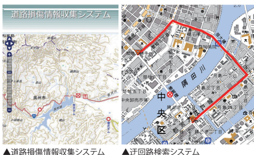
▲道路損傷情報収集システム ▲迂回路検索システム