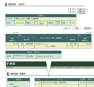
▲会計システム (TAS/Total Accounting System)