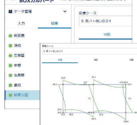
▲UC-1 Cloud 自動設計 BOXカルポート