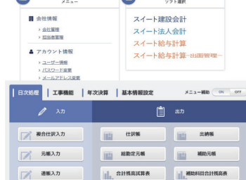
▲スィート会計シリーズ (法人会計・給与計算)