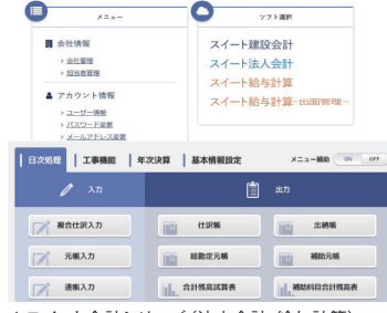
▲スイート会計シリーズ (法人会計・給与計算)