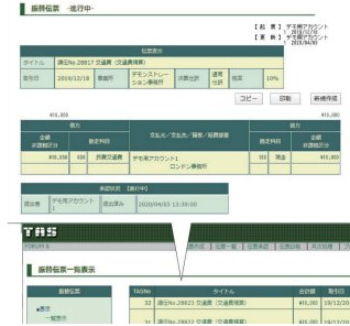
▲会計システム (TAS/Total Accounting System)