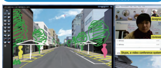
▲デザインミーティングの例:メイン画面での手書きデザイン 入力ビデオ会議システム (Skype) を利用した協議シーン