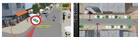
▲ディスカッション注釈の3Dアイコン表示 ▲視点位置はVRでシーンを自在に選定